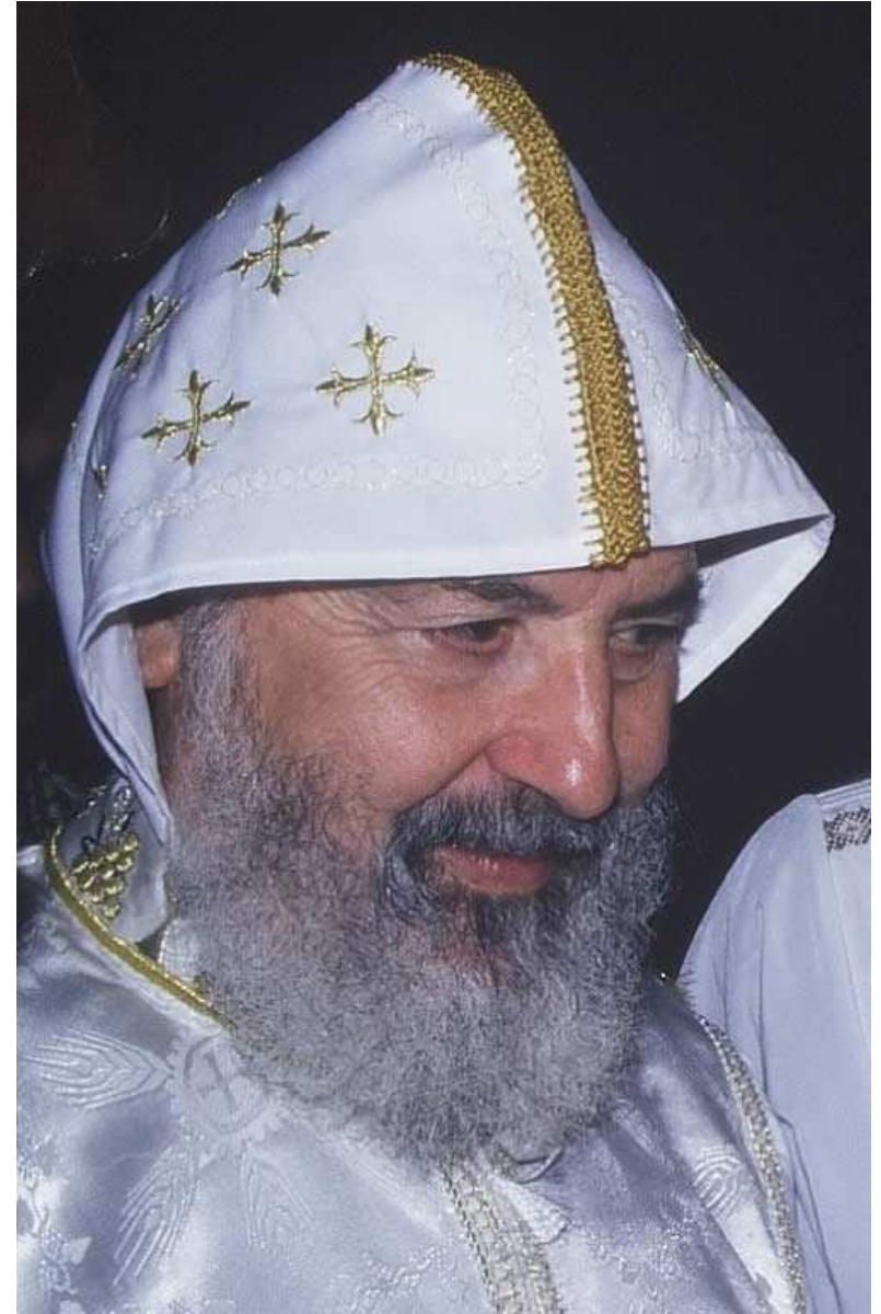
Monseigneur Abba Athanasios, Evêque Générale de toute la France